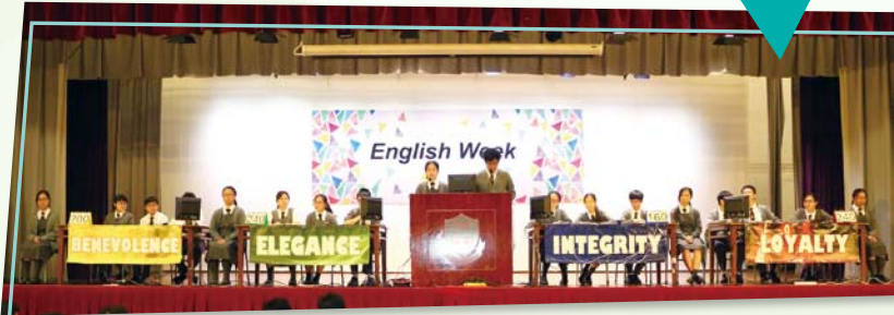
社際英文問答比賽