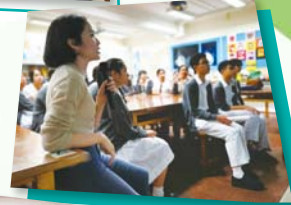
視覺藝術科專題活動 校友分享