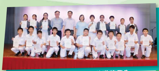
中一「功課之星」銅獎獲獎學生