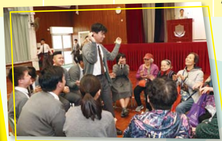
中四級 社會服務日

為擴闊學生的視野，提升學生對祖國的認識，鼓勵學生接觸不同地方的風土文化，本校為學生組織不同的跨境交流學習活動，到訪國內國外不同城市，進行各種學習與交流活動，以求全面提升學生的學習成效，並豐富學習的經驗。本年度下學期本校的重點交流學習活動是「上海經濟發展與城市規劃探索之旅」，詳情如下：