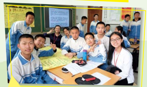
中國語文菁英北京學習團