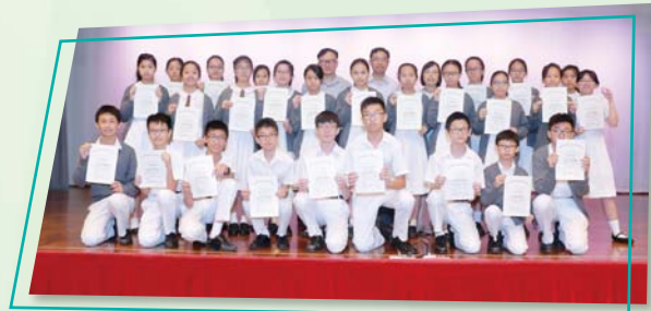
中一「功課之星」金獎獲獎學生