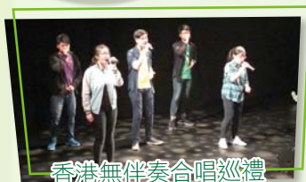
香港無伴奏合唱巡禮