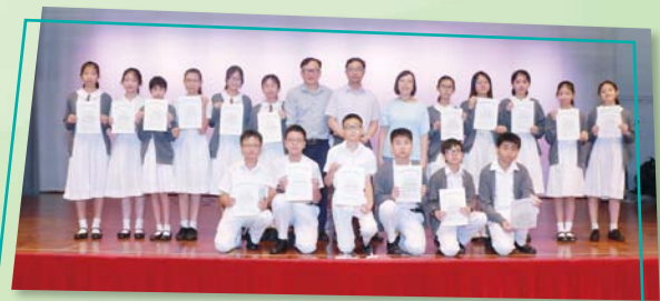
中一「功課之星」銀獎獲獎學生