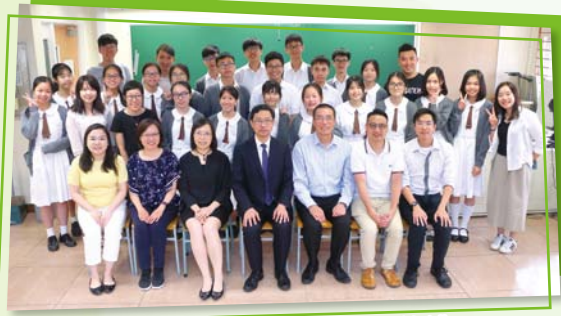
輔導組師兄師姐計劃嘉許禮

輔導組與中華基督教青年會（荃灣會所）合辦的師兄師姐計劃已完成，嘉許禮已於 5 月 22 日在學校舉行，獲獎同學如下：