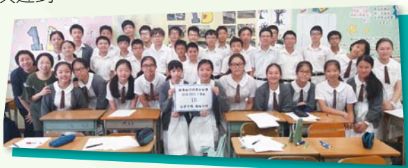
輔導組「守時之星」全班獎 1D

另外，輔導組設「守時之星」獎項：凡該月沒有同學遲到的班別，均獲頒獎狀一張，以資鼓勵。2019 年 5 月份「守時之星」獲獎班別為：1C、1D、3C、3D、4C、4D、5A 及 5D。