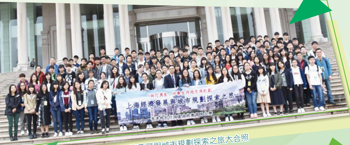
上海經濟發展與城市規劃探索之旅大合照