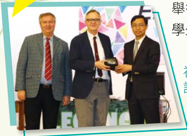
社際英文辯論比賽 評判與謝校長合照