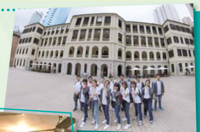
中四地理科 中環考察