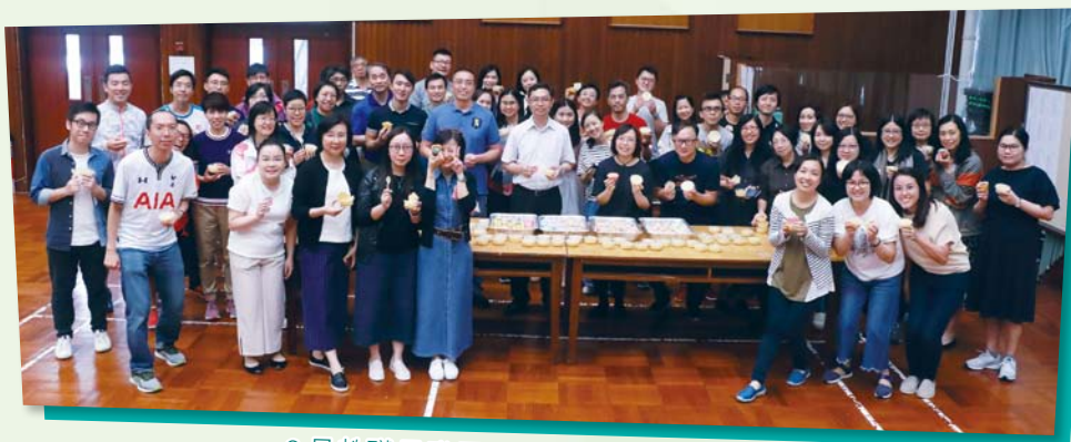
6月教職員發展日家教會慰勞教職員

家長教師會於6月12日教職員發展日，準備了美味的甜品慰勞全體教職員，作為「家長也敬師運動」的其中一環，聊表心意。