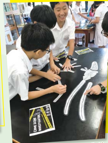
STEM 中一鑑識科學工作坊