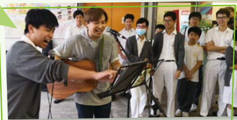
敢夢敢想 School Tour