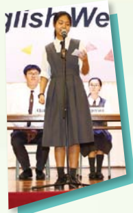
社際英文辯論比賽 最佳辯論員