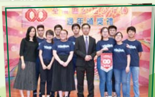
公益少年團周年頒獎典禮表演