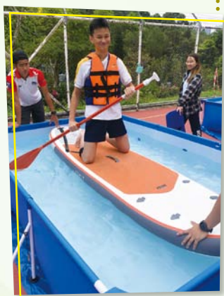
親水校園運動體驗計劃

計劃透過於校內舉辦一系列「非濕身」及創新陸上模擬訓練，讓學生能夠在不受地域限制和天氣影響下，體驗不一樣的水上活動，打破學生對水上活動的固有印象。表現良好的同學，會被挑選免費參與「直立板初級證書」及「中級銅章證書課程」。