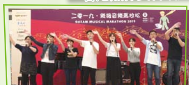
樂施音樂馬拉松籌款音樂演奏會