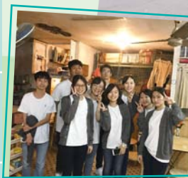
中四地理科 市區更新探知館