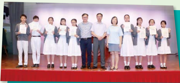
中一「功課之星」白金獎獲獎學生