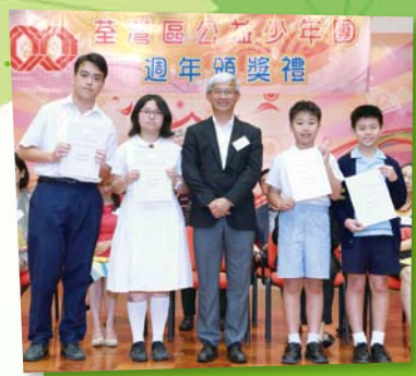
公益少年團 2018年傑出團員獎