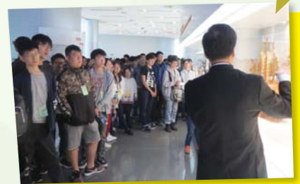
上海經濟發展與城市規劃探索之旅

此外，本學年本校同學在2019年3月至7月期間，通過學校已參與或將會參與的其他活動包括：