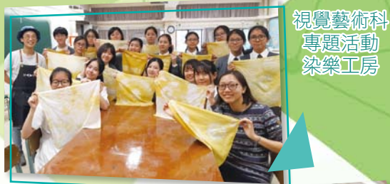
視覺藝術科 專題活動 染樂工房