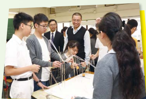
科學比賽課室初賽